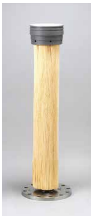
■ GL 型

化学処理では除去しきれない、さらに微細な粒子を除去し、より高度な水を得ることができるのがMF膜です。外圧式中空糸膜モジュールを使用しており薬品洗浄も行えるため日々のメンテナンスも容易に行うことができます。