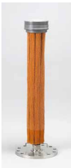
■ SL 型